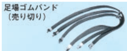
足場ゴムバンド (売り切り)